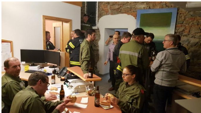
Begehung Fa. Doblinger 09.01.2018 inkl. Bewirtung