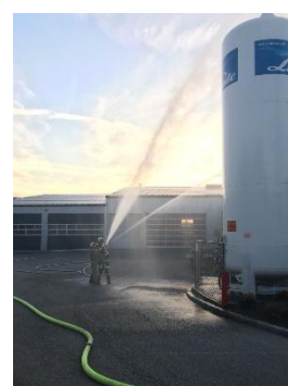
Frühjahrsübung 30.03.2018 – Übungsannahme Brand Fa. Streibl mit Personenrettung