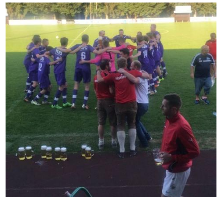
ORTSMEISTER - Pfingstturnier 2018