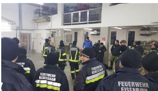
Personensuche mit Hundestaffel am 06.03.2018