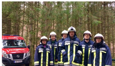
ColdWater Challenge 03.02.2018 - Einladung FF Schießdorf zu einer Grillerei am 24.08.2018