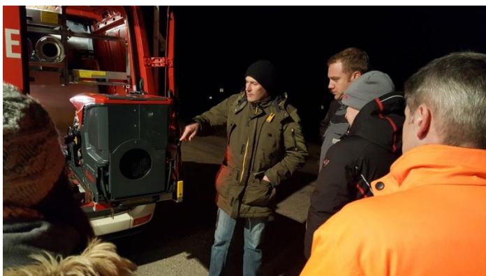
Schulung Aggregate & elektrische Geräte 20.03.2018

Aktuelle Infos immer auf www.ff-reikersham.at und auf Facebook unter FF Reikersham