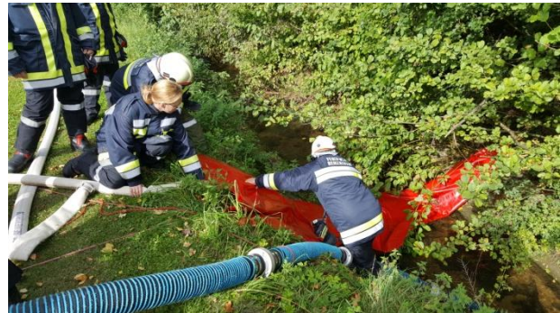
Maschinistenschulung mit praktischer Anwendung 22.09.2018