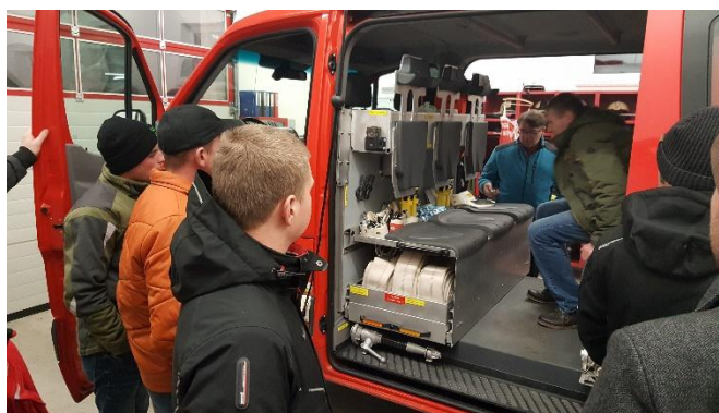
KLF Schulung am 20.02.2018